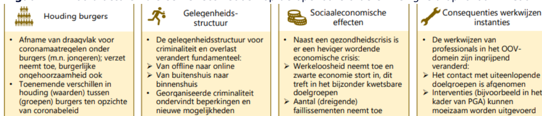
Figuur 1 Hoofdfactoren die een effect hebben op de openbare orde en veiligheid op lokaal niveau